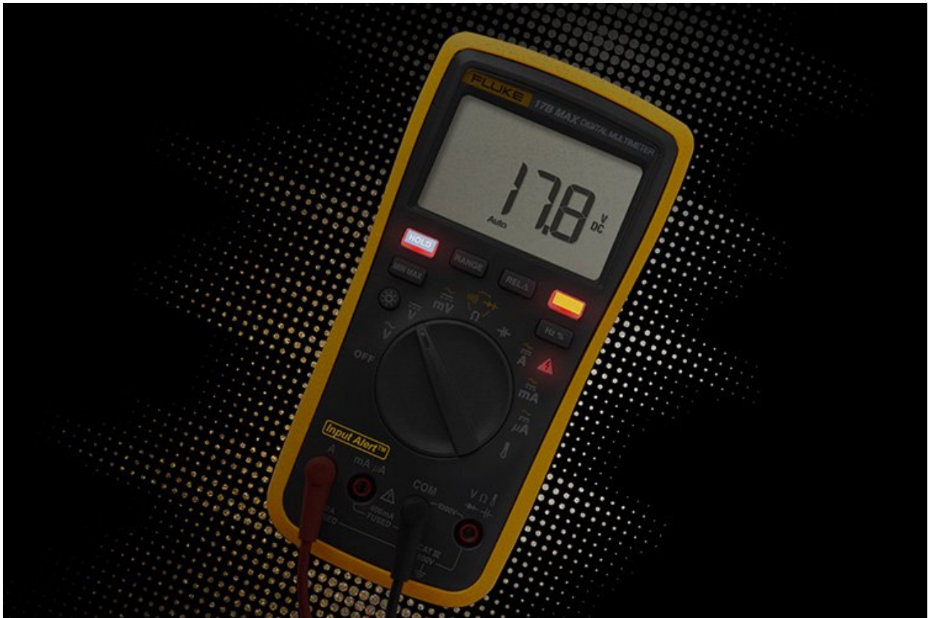
誤操作聲光警示，減少保險絲損壞