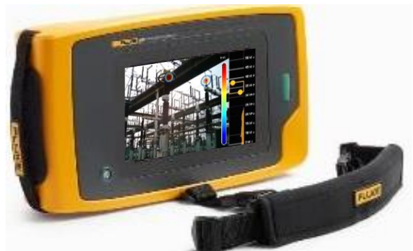
在可見光中準確定位局部放電位置