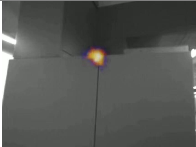
使用聲學成像儀對電氣櫃內部設備進行局部放電排查