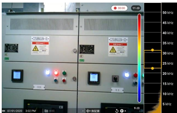
視頻時間起始，1#和2#櫃的散熱板均沒有超聲波能量顯示

通過觸控式螢幕快速調整聲學成像儀的頻段，局部放電的頻段通常在25-35kHz左右，所以該現場的聲學成像儀的頻段設置在23kHz-32kHz（下圖的黃色框），既能清晰地反映出局部放電的位置，又可以有效遮罩現場的雜訊干擾。