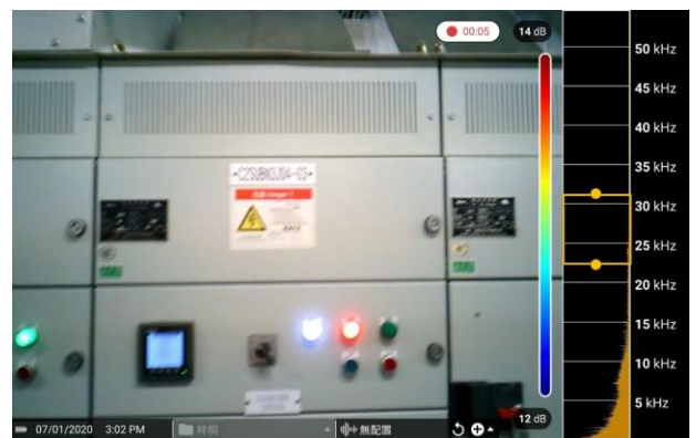
視頻時間5秒，3#櫃的散熱板也沒有超聲波能量顯示