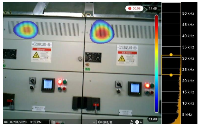
視頻時間9秒，在4#和5#櫃的散熱板處有明顯超聲波能量顯示能

一般情況下，密閉的電氣櫃內部的局放問題很難被發現，但通過散熱板可以清晰地看到內部的放電情況，此案例說明：超聲波能量可以經由散熱孔、鐵絲網或櫃門縫隙等空間傳遞出來，在一定條件下可用聲學成像儀進行排查。