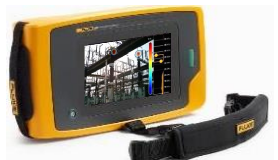
在可見光中準確定位局部放電位置